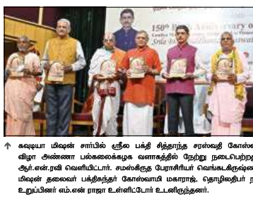
↑ கவுடியா மலைச் சாலைப் பக்கம் சித்திரைத் திருவிழை நோக்கிப் பிரயாணிகள் 150-ஆம் பிறந்தநாள் விழா அணைத்து பல்வேறுகூடிய வாழ்த்துக்கள் பெற்று நடைபெற்றது. இதில் விழா சீர்தயார் மணலர் அனாபி அன்னை வெளிப்பாட்டு, உரைநகரத் தோட்டாட்சிப் பேரவைகளுக்கும், துணை ஆட்சியர் குழுவுக்கும், கவுடியா மலைச் சாலைப் பக்கம் சித்திரை நோக்கிப் பிரயாணிகள் 150-ஆம் பிறந்தநாள் விழா அணைத்து பல்வேறுகூடிய வாழ்த்துக்கள் பெற்று நடைபெற்றது.